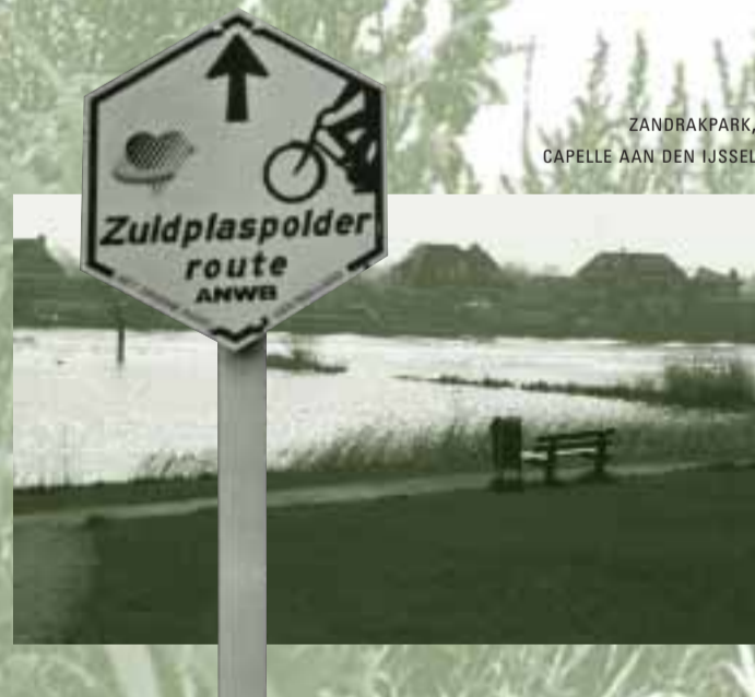
ZANDRAK PARK, CAPELLE AAN DEN IJSSSEL

"Als bouwverlener wil ik mensen laten meegenieten van het wonen aan een schonere en mooiere rivier. Zelf woon ik al 22 jaar aan de Hollandsche IJssel. Veel bedrijfsterreinen hebben hun economische functie verloren, waardoor leegstand en verval zijn ontstaan. De gebouwen, vaak met de rug naar de rivier gekeerd, leveren geen fraai schouwspel op. Woningbouwontwikkeling maakt slopen en saneren rendabel. En bewoners, maar zeker ook passanten, krijgen de rivier weer terug. Kijk naar het voormalige Feenstra-terrein in Capelle aan den IJssel. Dit verontreinigde terrein lag vele jaren braak; nu is er ruimte voor groen en rust. Of er meer aan cultureel erfgoed, natuur en recreatie moet worden gedacht? Natuur ontwikkelt zich steeds beter, mede dankzij het Project Hollandsche IJssel. Recreatie daarentegen trekt veel mensen aan, al dan niet gemotoriseerd. Daardoor ontstaat gevaar voor flora en fauna. Beheer van de oever is nodig. En behoud van cultureel erfgoed is een goed streven, maar zijn de kosten op te brengen? Woningbouwontwikkeling houdt rekening met veel facetten, waarbij het één vaak niet zonder het ander kan."