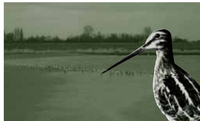
GROENEDIJK, NIEUWERKERK AAN DEN IJSSSEL

Het oeverbos is de traditionele groene Hollandsche IJssel-oever. De begroeiing bestaat uit biezem, riet en wilgen. Voor mensen is het oeverbos verboden terrein; voor dieren is het er goed toe. Gesignaleerd zijn onder andere grutto's, steltlopers, lepelaars, ringslangen en glasaaltjes.