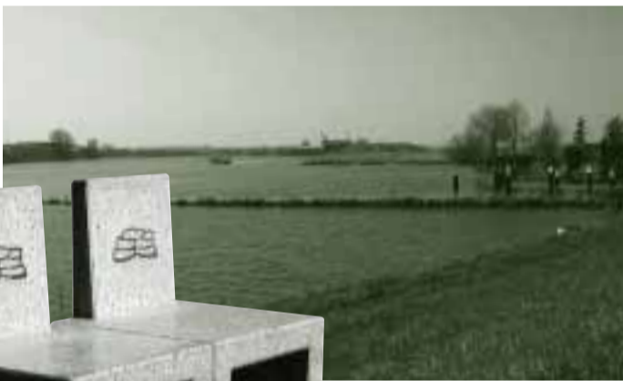
OEVER BIJ DE SNELLE SLUIS, MOORDRECHT

De HIJ-ZIT (het eigen zitmeubilair van de Hollandsche IJssel) biedt goed zicht op de rivier en haar oevers. Vooral groene oevers zijn geliefd. Iets om rekening mee te houden bij de herinrichting van zellingen.