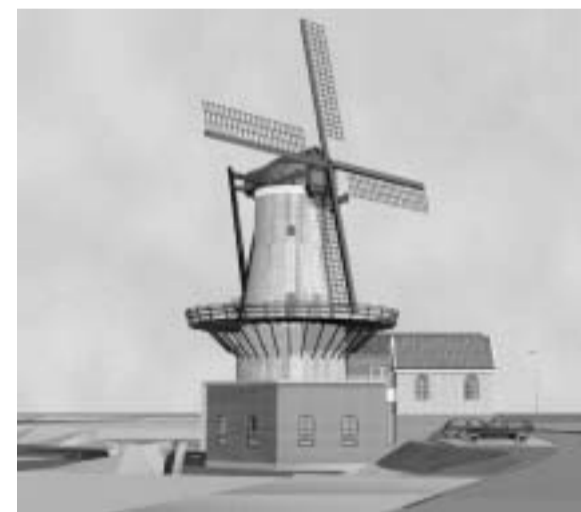
© EDIFICO ARCHITECTUUR & BOUWADVIES, BODEGRAVEN