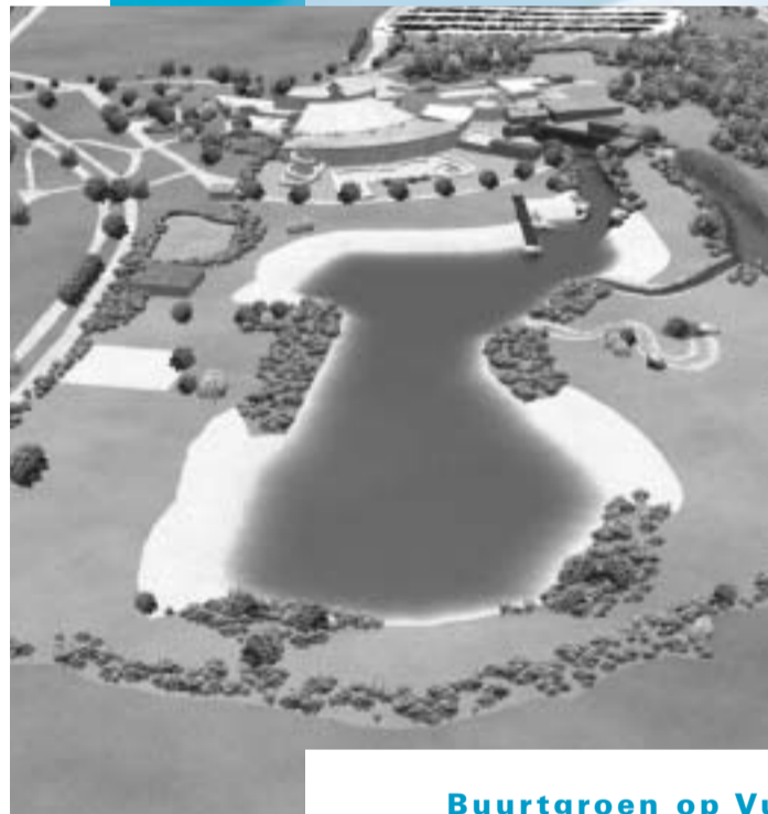
DUITS NATUURBAD ARTIST IMPRESSION

Meer over molen Windlust op www.kortenoord.nl