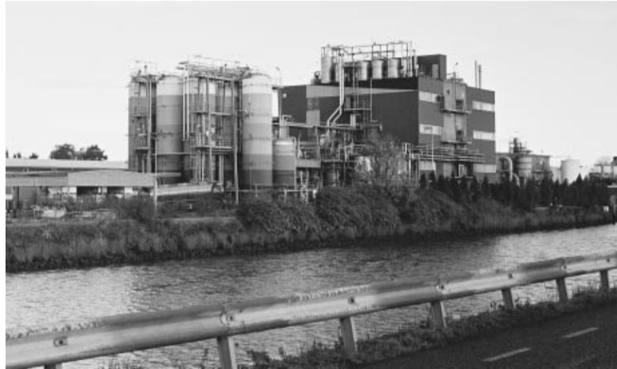
Niet alleen de bakstenen schoorsteen, ook het moderne machinepark van Unichema markeert de Hollandsche IJssel bij Gouda.