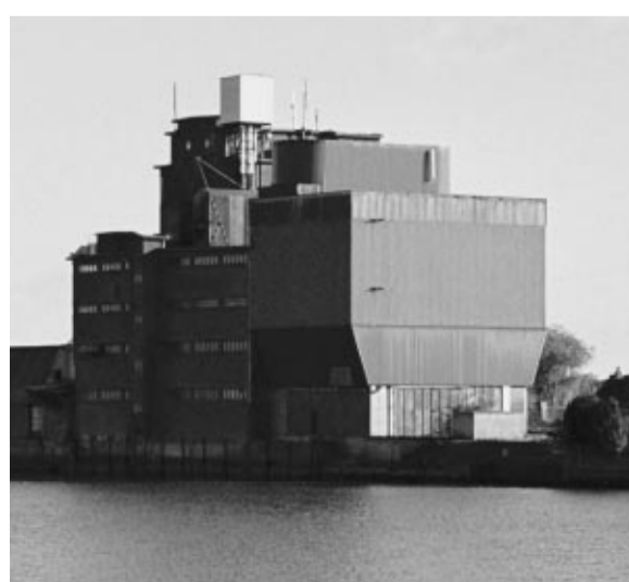
Langs de rivier staan nog een aantal oude graanmaalders. De maalderij in Gouderak (linkerfoto) heeft een traditioneel 'mansardedak', genoemd naar de 17e-eeuwse Franse architect F. Mansart. In Ouderkerk aan den IJssel staat een voormalige graanmaalders/rijstpellerij van een moderner type (rechterfoto). Deze typische oeverbebouwing is nu eigendom van Heuvelman Houthandel.