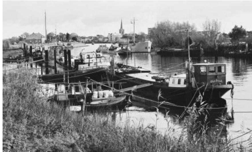
De werkhaven in Nieuwerkerk aan den IJssel is een voormalige rivierbocht en biedt nu beschutting aan een handvol woonschepen.

Industrieel erfgoed langs de Hollandsche IJssel