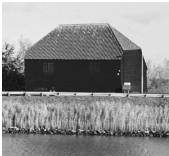
Dit type schuur (van zwart geteerd hout, maar dan met rieten dak) hoort bij het slagenlandschap van de Krimpenerwaard. Deze staat aan de dijk in Ouderkerk aan den IJssel. De vorm van het dak noemt men 'afgewolfd'.