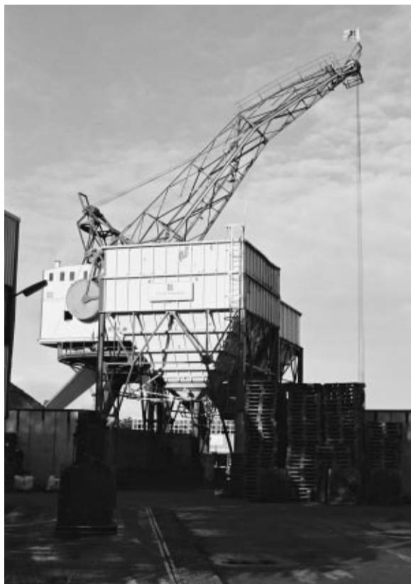
Betonmortelcentrale Rook in Krimpen aan den IJssel: karakteristieke bouwwerken voor de watergebonden bedrijvigheid.