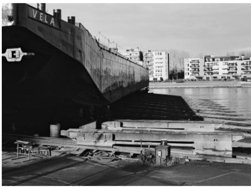
Van Duijvendijk in Krimpen aan den IJssel is de enige werf die over is van de vele kleine werven die ooit langs de Hollandsche IJssel lagen. Van het authentieke complex is veel bewaard gebleven: de dwarshelling, houten loodsen en de directeursvilla.

De Hollandsche IJssel is een werkrivier. Altijd geweest ook. Vroeger zorgden scheepswerven, steenbakkerijen en windmolens voor bedrijvigheid op en langs de rivier. Sommige overblijfsels hiervan werden zorgvuldig gerestaureerd en behouden voor het nageslacht. Intussen bepaalt een veelzijdigheid aan handel en industrie het oeverbeeld. Bijbehorende bouwwerken, zoals te zien op deze pagina, bepalen mede het karakter van de rivier. Zij kunnen het industrieel erfgoed van de toekomst zijn. Reden om nu alvast na te denken over hun betekenis en toekomstige rol in de Hollandsche IJsselstreek.