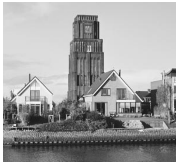
Deze watertoren (1924) houdt de herinnering aan de Moordrechtse KVT-fabriek levend.