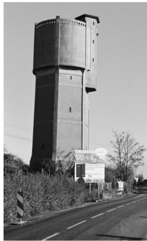
De watertoren van Ouderkerk aan den IJssel (1916) is opgetrokken uit beton en ijsselsteenjes. De eigenaar heeft het plan er zijn kantoor te vestigen.

De Hollandsche IJssel is een werkrivier. Altijd geweest ook. Vroeger zorgden scheepswerven, steenbakkerijen en windmolens voor bedrijvigheid op en langs de rivier. Sommige overblijfsels hiervan werden zorgvuldig gerestaureerd en behouden voor het nageslacht. Intussen bepaalt een veelzijdigheid aan handel en industrie het oeverbeeld. Bijbehorende bouwwerken, zoals te zien op deze pagina, bepalen mede het karakter van de rivier. Zij kunnen het industrieel erfgoed van de toekomst zijn. Reden om nu alvast na te denken over hun betekenis en toekomstige rol in de Hollandsche IJsselstreek.